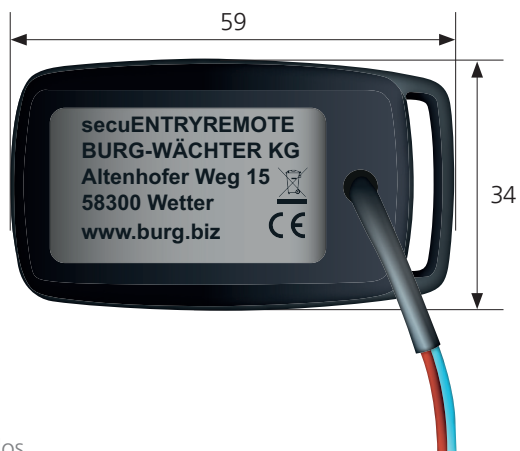
Vue de dos