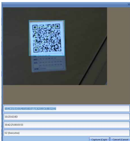
Fig. 2 : Scan code QR