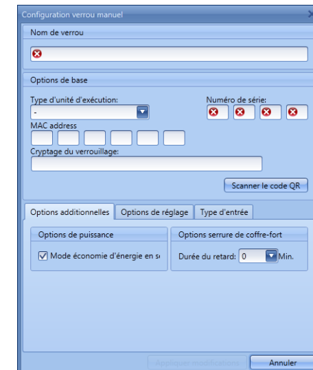
Fig. 1 : Configuration manuelle de serrure