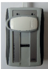
Abb.2: Leseplatzierung des Transponders

Legen Sie den Transponder auf den RFID Lesebereich der secuENTRY pro 7073 ENROLMENT Einheit.