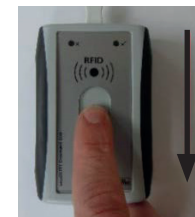
Abb. 5: Zugrichtung des Fingers beim Anlernen

Die Software gibt Ihnen die weiteren Anweisungen vor. Um Ihren Fingerscan in das System einzulesen, ziehen Sie bitte Ihren Finger in Pfeilrichtung über den Sensor.