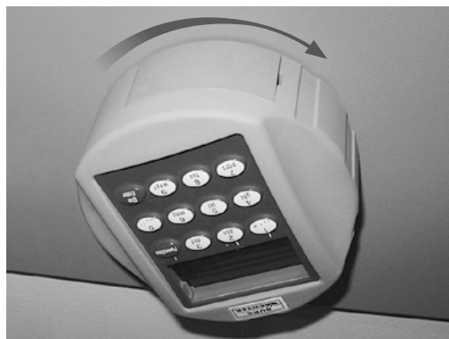
Εισαγωγή κωδικού / Koodi sisestamine