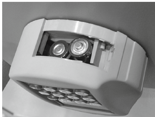
Μπαταρίες / Patareid: 2x 1,5V Mignon (LR6)